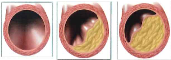
<動脈硬化イメージ(*)>